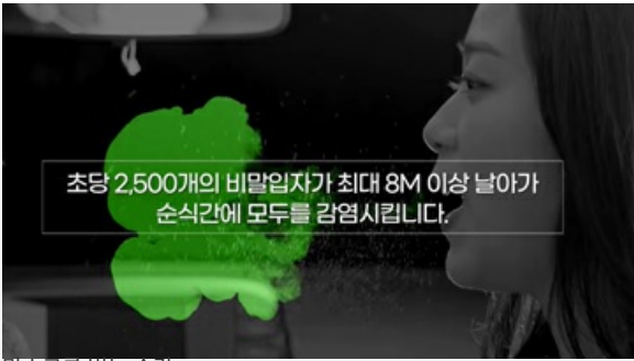
마스크를 벗는 순간