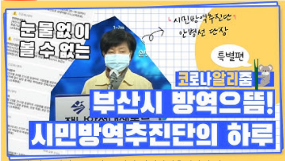
[코로나 뭐든 알리줌 10편] 부산시 시민방역추진단의 하루