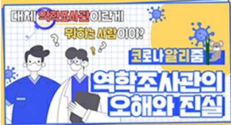
[코로나 뭐든 알리줌 4편] 역학조사관의 오해와 진실! 부산시 역학조사반은 어떤 일을 할까?