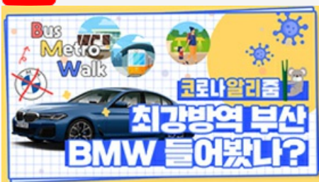
[코로나 뭐든 알리줌 6편] 부산 BMW 믿어도 되나??