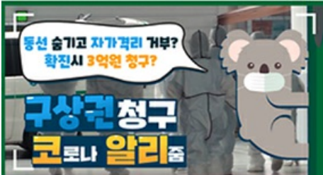
[코로나 뭐든 알리줌 2편] 동선 숨기고 자가격리 거부? 구상권에 관한 모든 것