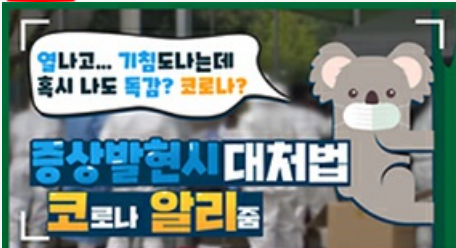
[코로나 뭐든 알리줌 1편] 열나고 기침도 난다! 나도 혹시 독감? 코로나?